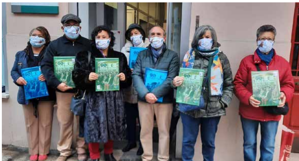
Nuevos Voluntarios de Cuenca