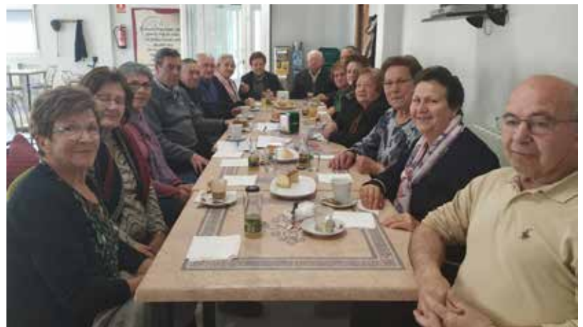
Aguas Nuevas (prepandemia)