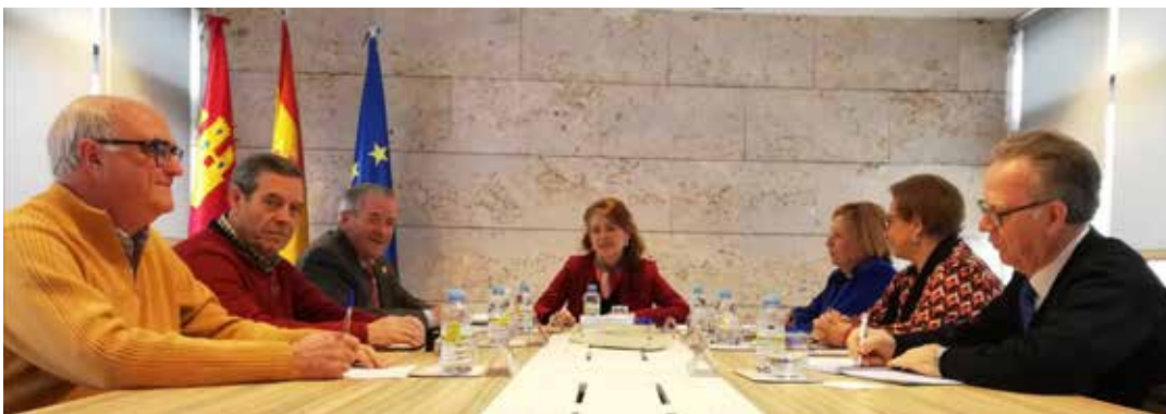
Reunión en Toledo con la Consejera de Bienestar Social