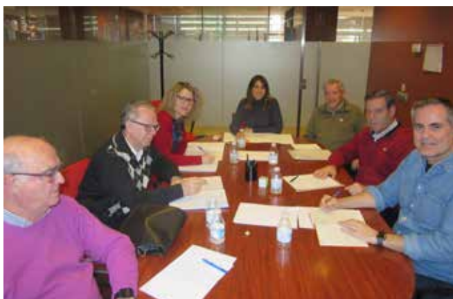
Reunión en Toledo con la Directora General de Mayores