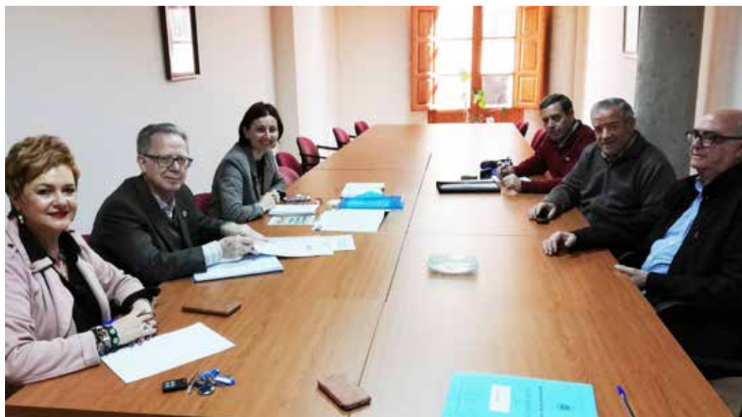
Reunión en San Clemente para la preparación de la Jornada