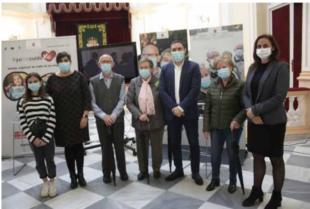
Voluntarios de Cuenca

El objetivo de este curso es facilitar a los coordinadores una serie de recursos, adaptados a la situación actual de pandemia, que ayuden a mejorar su tarea como coordinadores del grupo de voluntarios.