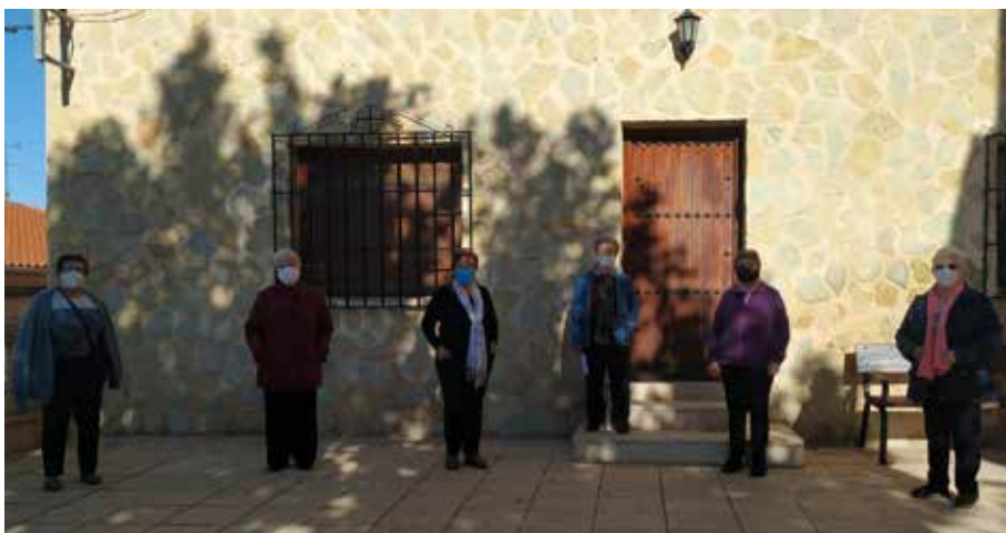
Navas de Jorquera