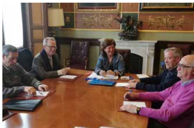
Reunión en la Diputación de Ciudad Real

La Asamblea del 27 de febrero sí se realizó, pero más adelante se tenía previsto realizar más asambleas, una General Extraordinaria con la presentación de la Memoria de 2019 el 25 de marzo y otra Ordinaria el 23 de septiembre, ambas tuvieron que suspenderse por la crisis sanitaria. Durante el mes de septiembre se realizó la Asamblea General Ordinaria de la Organización Nacional UDP de manera virtual, con la participación de 5 representantes de la Federación Territorial de CLM UDP